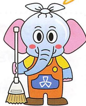
品川区清掃事務所キャラクター しながわきれいにする象